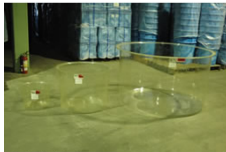
STCパンライトタンク

プラスチックの中でも耐衝撃に優れたポリカーボネート(帝人)インライト)を原料とした丸型容器で全国の種苗生産施設で使用されています。稚魚の育成、クロレラ、ワムシ等の培養に適しています。他の樹脂に比べ、耐熱、耐寒性にも優れています。PE(ポリエチレン)製の黒タンクも500L、1000Lと取り揃えています。