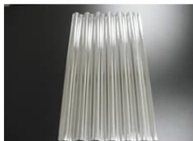
PC(ポリカーボネート)コレクター

ポリカーボネートシートを波板に真空成形した付着板で厚みが0.3mmと鉄板小波の半分以下なので軽量で取扱いに便利です。専用のコレクターホルダーにセットして使用します。