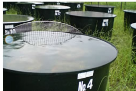
STCポリエチレンタンク(黒)