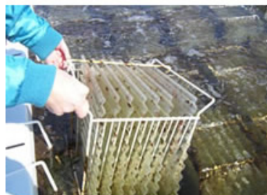
PC(ポリカーボネート)波板

透明性と耐衝撃に優れておりアワビ、ウニ、ナマコ等の種苗生産に必要な珪藻を付着させることができます。形状は鉄板小波でサイズはご要望に応じて加工いたします。専用のコレクターホルダーにセットして使用します。